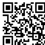
あずかるこちゃん

クーリングシエルターをご存じですか？(熱中症警戒アラートが発表された時などに一般へ開放し暑さをしのぐ場所)