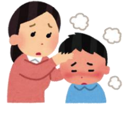
病気の家族のケア