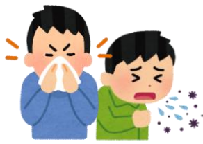
咳やくしゃみ 鼻をかんだ後